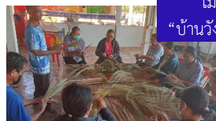
ไม้กวาด “บ้านวังปลาบ้อม”

https://www.facebook.com/ผ้าไทยแม่เพ็ญotop-100062871141564/