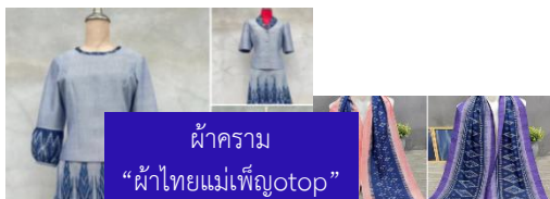
ผ้าคราม “ผ้าไทยแม่เพ็ญotop”

https://www.facebook.com/ผ้าไทยแม่เพ็ญotop-100062871141564/