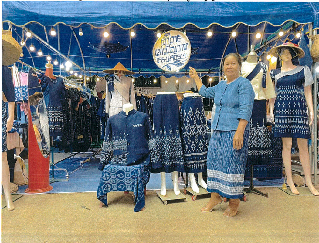
รูปโครงการส่งเสริมและอนุรักษ์ภูมิปัญญาท้องถิ่น